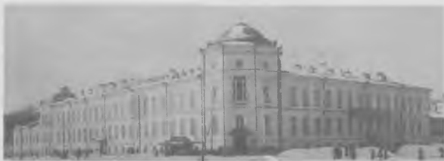
Факультетские терапевтические клиники Томского университета