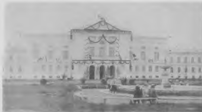
Императорский Томский университет (90-е гг. XIX в.)