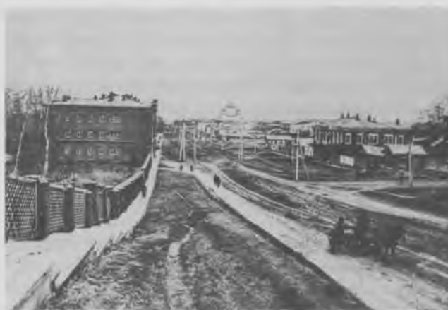
Садовая улица (слева — здание студенческого общежития, в настоящее время 3-й учебный корпус ТГУ)