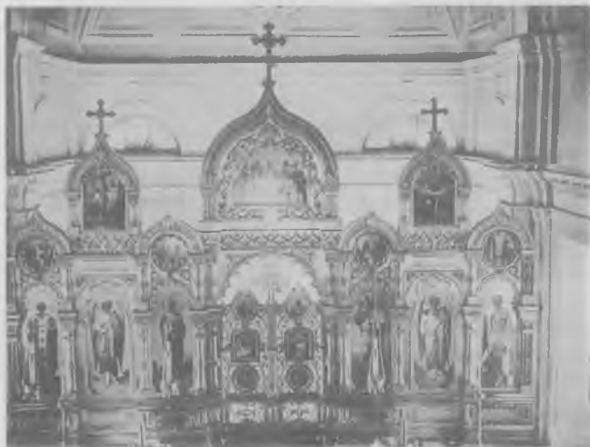
Иконостас и часть алтарной стены университетской церкви